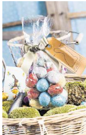
Machen süchtig. Die feinen Möweneier gibt es in Basel exklusiv bei Xocolatl.

www.musthave.ch www.lovefashionandfood.com www.swiss-candles.com