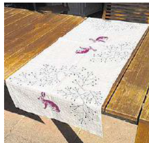
Schön schlicht. Handbedruckte Tischläufer des Schweizer Labels «For the Love of Fashion and Food».